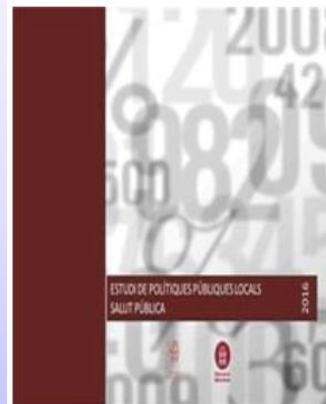
Estudi de Polítiques Públiques Locals Salut Pública 2016