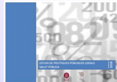
Estudi de Polítiques Públiques Locals Salut Pública 2018