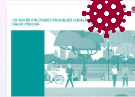
Estudi de Polítiques Públiques Locals Salut Pública 2021