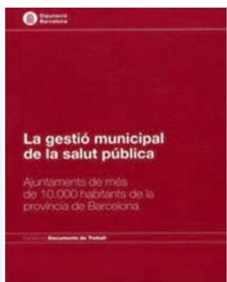
La gestió municipal de la salut pública