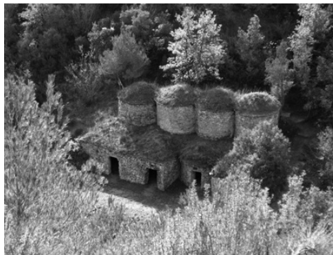
Tines del Tosques

fàcilment accessibles, però també en zones elevades i de difícil accés pel fet de trobar-se en llocs amb pendent i separades dels camins. Trobem tres zones de concentració de tines, la primera al llarg de la riera de Mura i el desguàs al Llobregat, que vertebrava un territori que comprèn els municipis de Talamanca i el Pont de Vilomara, tant l'espai de vall al costat de la riera com als vessants propers. La segona zona la trobem al llarg del camí que porta al mas el Flequer i que segueix el torrent del Flequer. La tercera zona, delimitada pel sud pel torrent de Santa Creu i per la serra del Puig Gili pel nord, és una zona en què es troben les valls dels torrents i les zones de vessants de les serres de Puig Gili, Ermitanets i el Farell, en un territori de desnivells acusats i on trobem tines tan aviat a prop dels cursos d'aigua, com les trobem als vessants de la muntanya, com a la carena.