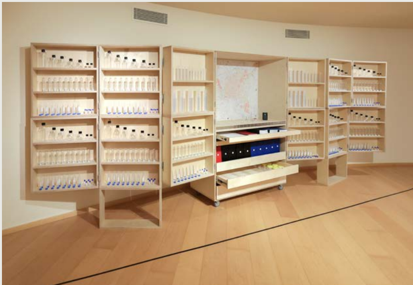
Estructura de madera y objetos Medidas diversas