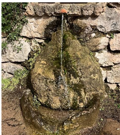
Figura 1. Comunitat de Cratoneurion commutati , formadora de pedra tosca o travertí. Font d'Aiguafreda de Dalt (esquerra); Palustriella commutata , briòfit calcícol característic d'aquests hàbitats, imatges de M. Fernández i J. Corbera).

Les fonts es comporten com a hàbitats illa dins els ecosistemes mediterranis. La disponibilitat d'aigua és generalment permanent a les fonts, mentre que és escassa en els hàbitats que les envolten. Aquesta característica les converteix en refugis crucials per a una àmplia gamma d'organismes, especialment durant els períodes de sequera. Les fonts actuen com a punts calents de biodiversitat per diverses raons. La seva alta heterogeneïtat espacial, formada per un mosaic de microhàbitats, explica l'elevat nombre de taxons que coexisteixen en pocs metres quadrats. A més, l'estabilitat tèrmica i química d'aquests ambients sovint sosté una biota única amb un gran nombre d'espècies endèmiques que es troben només en una sola font, contribuint significativament al seu alt valor de conservació. En aquest sentit destaquen especialment les fonts petrificants formadores de travertí o tosca, sovint dominades per la molsa Palustriella commutata , que són considerats Hàbitats d'Interès Comunitari prioritari segons la Directiva d'Hàbitats de la UE 1 (HIC 7140, Cratoneurion commutati ; Directiva 97/62/UE; figura 1 ).