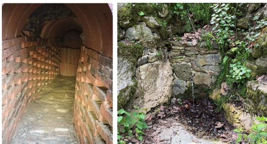
Figura 2. Mina de la font de Santa Maria (Montnegre, esquerra,), actualment tapada per una boca de formigó després d'una actuació de recuperació després de la sequera (2021-2024). A la dreta, font de la Nespereta (Montnegre,), remodelada

amb ciment, fet que va eliminar l'escorrentia superficial i, conseqüentment, l'hàbitat d'una població d' Echinogammarus longisetosus .