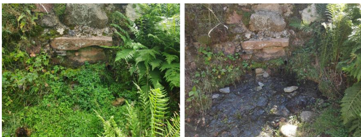
Figura 3. Imatges de la font de Claretà, al Montseny, abans (juliol de 2024, a l'esquerra) i després (agost de 2024, a la dreta) d'una actuació d'aclarida de la vegetació. S'observa una reducció dràstica del recobriment vegetal, amb l'eliminació de racons humits i ombrívols que actuen com a potencials microhàbitats per a invertebrats, amfibis i flora fontinal.

Les intervencions de manteniment sovint no tenen en compte la conservació de la biodiversitat, i eliminen la vegetació i la fauna present sense considerar l'impacte ecològic. Aquestes actuacions poden eliminar microhàbitats clau i comunitats biològiques establertes durant anys (figura 3).