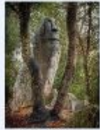
Premi públic "El mossà d'Òniu", de Xavier Rotanell i Jocs.