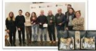
Acte de lliurament de premis. 16 de desembre 2024-Cal Trempat (Vilanova del Vallès)