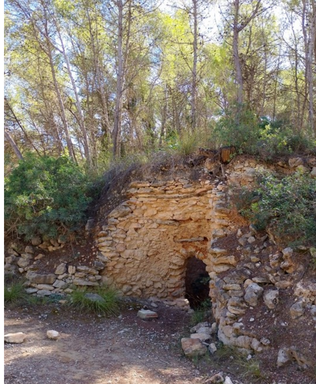
Forn de calç (Coll d'Entrecort, Sant Pere de Ribes)