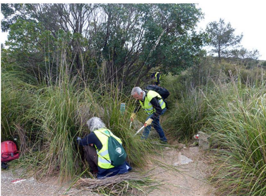
Voluntaris treballant al tram del GR-92.