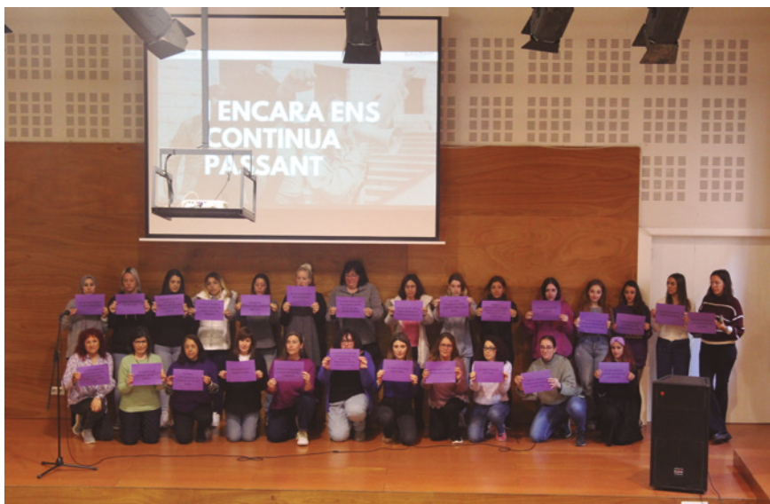
Foto d'arxiu de l'acte commemoratiu del 8M de 2025

Participa i col·labora en l'elaboració del Mural des del 6 març al 2 d'abril en l'horari habitual d'obertura de la Torre d'en Gorgs.