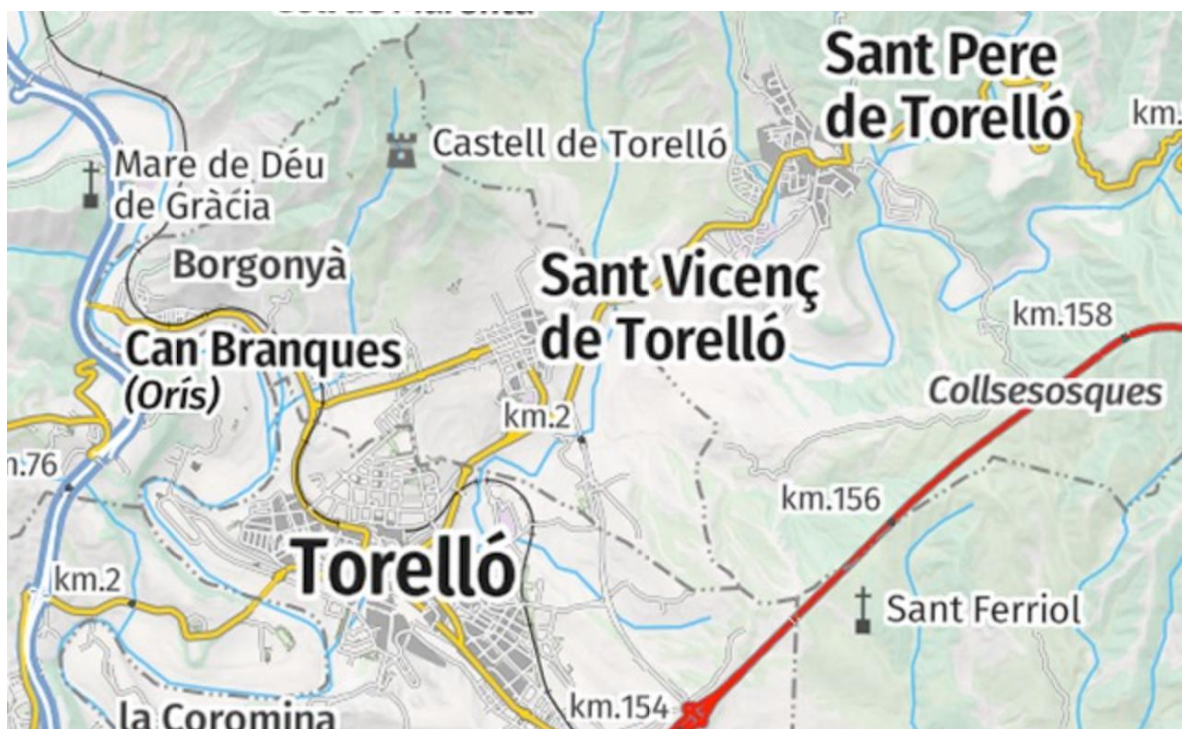
Imatge 1. Mapa de Sant Vicenç de Torelló