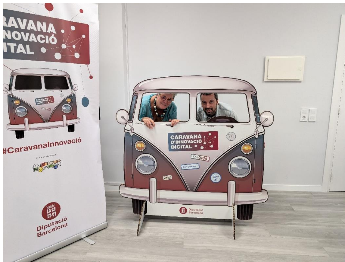
L'amfitriona i el relator pugen a la Caravana Innovació Digital