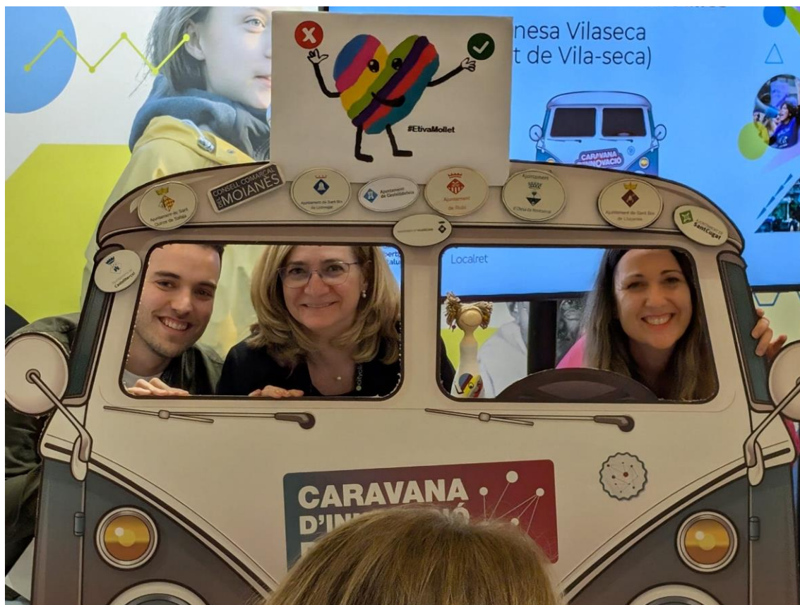
La relatora i l'equip amfitrió de la parada pugem a la Caravana Innovació Digital, aparcada en la plaça de la Revolució del Congrés Govern Digital 2025