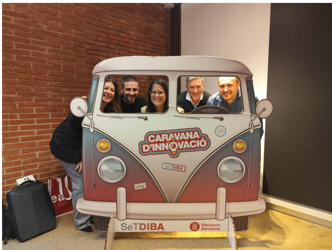
El relator i l'equip amfitrió de la parada pugen a la Caravana Innovació Digital