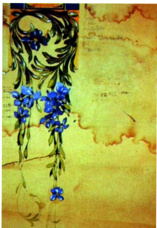
Dibuix de l'arrimador del catàleg de l'empresa Hijo de Jaime Pujol y Bausis segons idea de l'artista Adrià Gual (AMEL, Fons Pujol i Bausis).

Coincidències Insòlites és una activitat de la xarxa de Museus Locals de la Diputació de Barcelona.