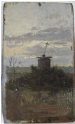
Pintura d'Andreu Solà.

Museus en xarxa, coincidències insòlites és una activitat de la Xarxa de Museus Locals. Els museus participants posen en diàleg dues peces o un esdeveniment que implica una relació simbòlica, estètica o conceptual. Aquesta proposta permet reflexionar sobre els objectes, els esdeveniments, els museus i els municipis.